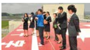
▲宿泊研修(専攻科1年)